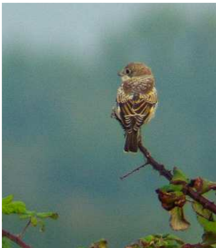
Pie-grièche à tête rousse. Les Moutiers-en-Retz (H. Touzé)

Grosbec casse-noyaux : 1 couple avec 2 jeunes volants est observé le 15/07 à Saint-Aignan-de-Grandlieu (SR) ; la reproduction est notée de façon certaine au Bois de Thiouzé, Sion-les-Mines le 19/07 (JM) et 1 individu est observé à Fercé ce même jour (DG).