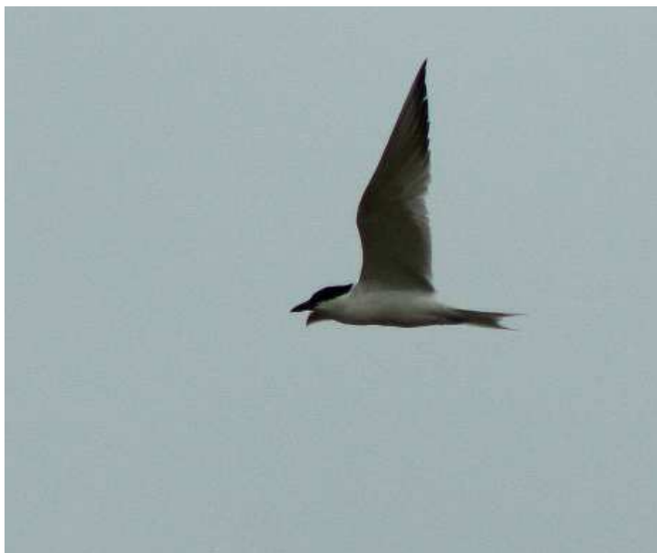
Sterne hansel, Le Collet (H. Touzé)