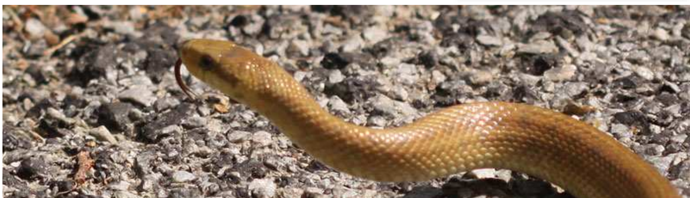
Couleuvre d'Esculape, La Chapelle-sur-Erdre (C. Léhy)