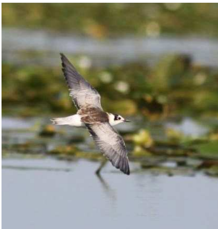
Guifette leucoptère, lac de Grand-Lieu (S. Reeber)

Cigogne noire : Belle série d'observations avec 1 le 28/07 à Batz-sur-mer (AG) ; 1 le 02/08 à Bourgneuf-en-Retz (HT) et 4 ce même jour à Vioreau, Joué-sur-Erdre (PM) ; 1 à la Chapelle-Glain le 08/08 (FB) et 1 ce même jour à Assérac (EB) ; 1 le 14/08 à Héric (AJ) ; 1 le 15/08 à Ancenis (VT) et 2 autres à Oudon (AB) ; 1 le 16/08 à St-Molf (GB) ; 1 le 19/08 à Lancastria, Les Moutiers-en-Retz (HT) ; 1 le 31/08 à Guérande (FRe).