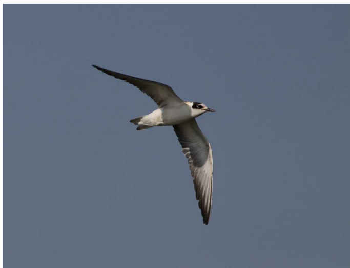
Guifette leucoptère, lac de Grand-Lieu

Pouillot siffleur : observation d'un individu le 28/07 à Joué-sur-Erdre (SA).