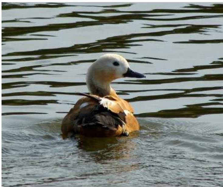
Tadorne casarca, Les Gâtineaux (H. Touzé)

Blongios nain : 1 jeune de l'année est noté le 10/08 au Lac de Grand-Lieu (SR) ce qui laisse penser que cette espèce rare dans le département et très difficile à contacter, s'est peut-être reproduite sur le site.