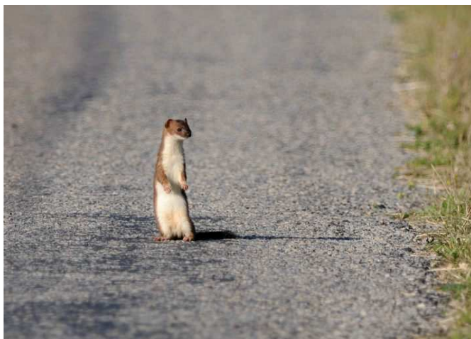
Hermine, Bourgneuf-en-Retz (P. Ouvrard)