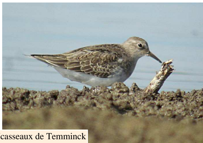
Bécasseaux de Temminck juv. - lac de Grand-Lieu