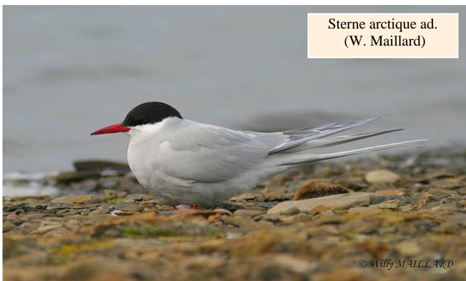
Sterne arctique ad.

Dès le mois de juillet, les premières sternes commencent à se rassembler sur les rochers, stationnant essentiellement à l'ouest du port ainsi que le long du sentier côtier en direction de la Prée/la Plaine-sur-Mer. C'est à partir de cette saison qu'il faudra rechercher les Sternes caugeks Sterna scandiavica et pierregarins Sterna hirundo , parmi lesquelles se trouvent parfois dès le mois d'août des espèces plus rares comme les Sternes arctique Sterna arctica , de Dougall Sterna dougallii , caspienne Sterna caspia ou naine Sternula albifrons . Signalons également une mention de Sterne élégante Sterna elegans en août 1995 à l'est du port.