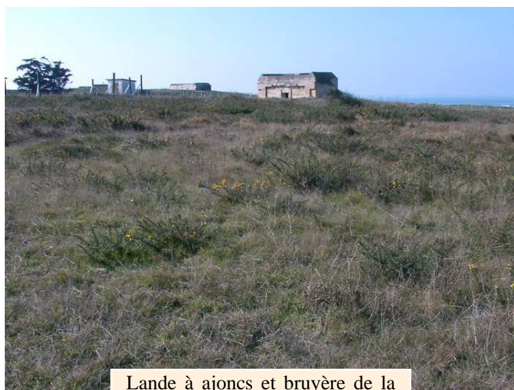
Lande à ajoncs et bruyère de la pointe Saint-Gildas (W. Maillard)

Parmi les insectes, on notera la présence du Demi-deuil Melanargia galathea , du Vulcain Vanessa atalanta , du Procris Coenonympha pamphilus , de la Belle dame Vanessa cardui , du Citron Gonepteryx rhamni , du Tircis Pararge aegeria et du Souci Colias crocea pour les papillons ; du Sympétrum sanguin Sympetrum sanguineum et du Sympétrum méridional Sympetrum meridionale pour les odonates, principalement notés en migration. Comme pour les oiseaux, d'autres espèces exceptionnelles sur les côtes sont possibles comme le Monarque Danaus plexippus (observé à plusieurs reprises en Vendée) et l'Anax de juin Anax junius (une seule mention française pour cette espèce américaine...et sur ce même site!).