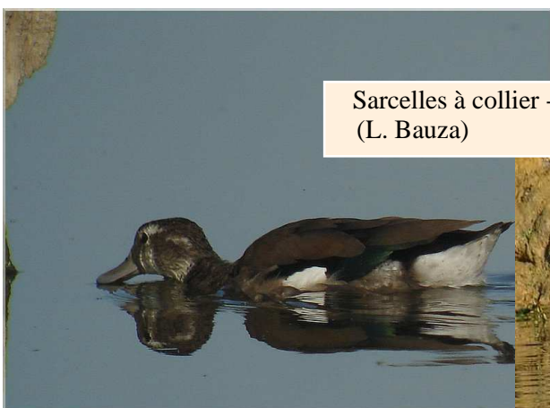
Sarcelles à collier - Grand-Lieu (L. Bauza)

Sur le front des grands échassiers, on notera surtout la présence des 3 Ibis falcinelles * signalés ce printemps en Brière jusqu'au 15/08 au moins (JLD, DM, AT), ainsi que le poursuite d'une série d'observations de Cigognes noires assez exceptionnelle : 1 juv. sur le chemin des Carris, Frossay le 15/08 (FN), 3 au Migron, Frossay, le lendemain (FN), 2 au nord de la Brière le 19/08 (JLD), 1 en vol à Tréhé, Brière, le 19/08 (DR), 2 à Saint-Lyphard le 21/08, peut-être les mêmes que celles vues le 19/08 (JLD), et toujours en Brière, 2 le 2/09 (JLD) et 1 le 8/09 (JLD), 1 au marais de Pingliau, Besné, le 8/09 (MM), 1 à Saint-Hilaire-de-Clisson le 11/09 (PO) et 1 à la gare de péage du Bignon le 25/08 (DM). Si on y ajoute les oiseaux mentionnés en juillet et août dans le bulletin précédent, on arrive à un total de 42 oiseaux lors du passage post-nuptial 2007 en Loire-Atlantique ! A signaler aussi un groupe de 26 Cigognes blanches à Saint-Michel-Chef-Chef le 9/09 (JLB).