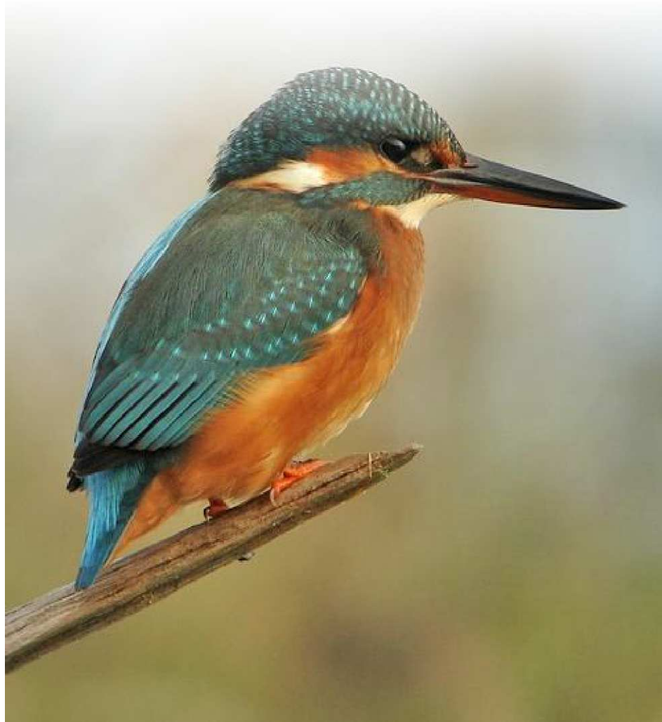
Martin-pêcheur d'Europe (J. Riffé)