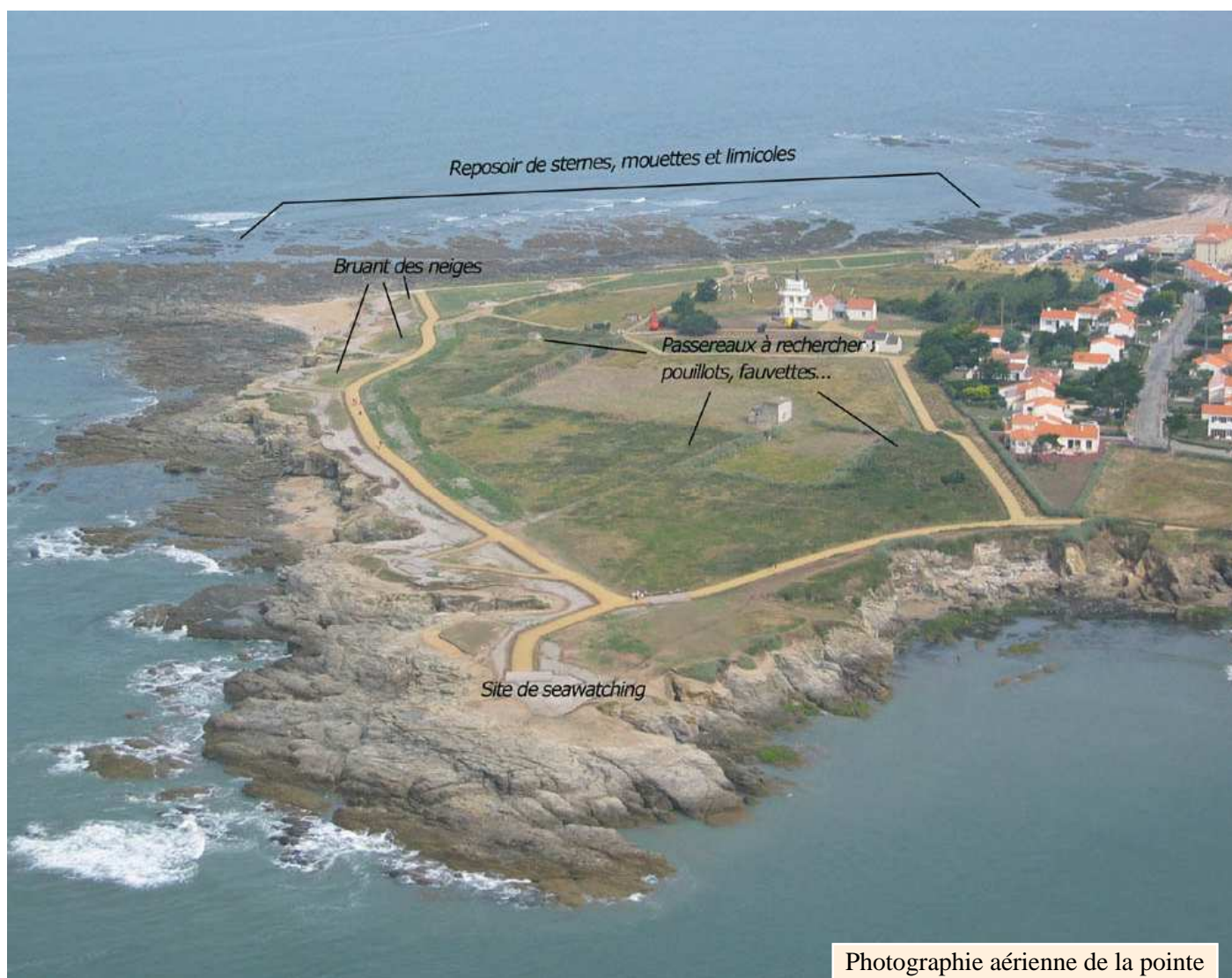
Photographie aérienne de la pointe Saint-Gildas

Parmi les insectes, on notera la présence du Demi-deuil Melanargia galathea , du Vulcain Vanessa atalanta , du Procris Coenonympha pamphilus , de la Belle dame Vanessa cardui , du Citron Gonepteryx rhamni , du Tircis Pararge aegeria et du Souci Colias crocea pour les papillons ; du Sympétrum sanguin Sympetrum sanguineum et du Sympétrum méridional Sympetrum meridionale pour les odonates, principalement notés en migration. Comme pour les oiseaux, d'autres espèces exceptionnelles sur les côtes sont possibles comme le Monarque Danaus plexippus (observé à plusieurs reprises en Vendée) et l'Anax de juin Anax junius (une seule mention française pour cette espèce américaine...et sur ce même site!).