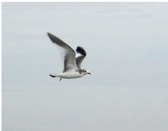
Mouette de Sabine juv. lac de Grand-Lieu (S. Reeber)