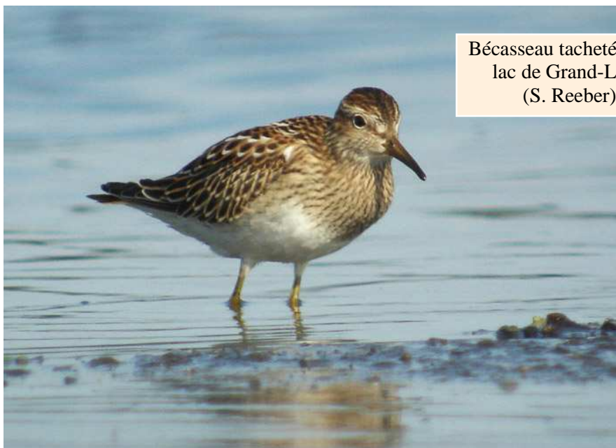
Bécasseau tacheté juv. - lac de Grand-Lieu