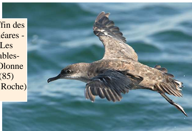
Puffin des Baléares - Les Sables-d'Olonne (85)

Sur le front des grands échassiers, on notera surtout la présence des 3 Ibis falcinelles * signalés ce printemps en Brière jusqu'au 15/08 au moins (JLD, DM, AT), ainsi que le poursuite d'une série d'observations de Cigognes noires assez exceptionnelle : 1 juv. sur le chemin des Carris, Frossay le 15/08 (FN), 3 au Migron, Frossay, le lendemain (FN), 2 au nord de la Brière le 19/08 (JLD), 1 en vol à Tréhé, Brière, le 19/08 (DR), 2 à Saint-Lyphard le 21/08, peut-être les mêmes que celles vues le 19/08 (JLD), et toujours en Brière, 2 le 2/09 (JLD) et 1 le 8/09 (JLD), 1 au marais de Pingliau, Besné, le 8/09 (MM), 1 à Saint-Hilaire-de-Clisson le 11/09 (PO) et 1 à la gare de péage du Bignon le 25/08 (DM). Si on y ajoute les oiseaux mentionnés en juillet et août dans le bulletin précédent, on arrive à un total de 42 oiseaux lors du passage post-nuptial 2007 en Loire-Atlantique ! A signaler aussi un groupe de 26 Cigognes blanches à Saint-Michel-Chef-Chef le 9/09 (JLB).