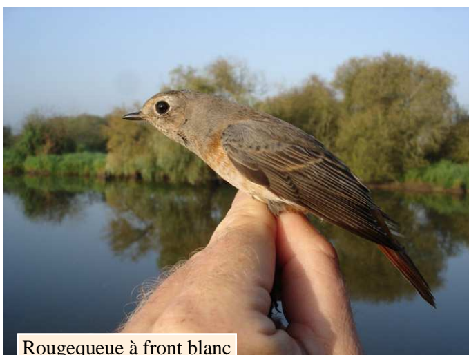
Rougequeue à front blanc lac de Grand-Lieu